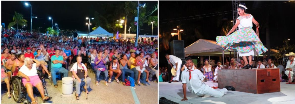
Figura 5 y 6. Festival anual Fandangro 2019