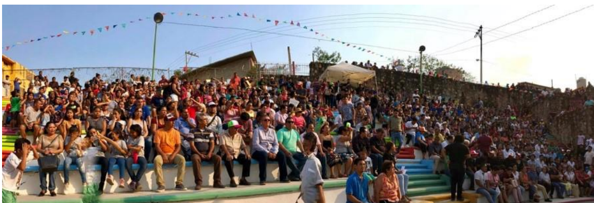
Figura 4. Auditorio durante Fandangro Itinerante.

Como un fenómeno cultural que surge “desde abajo”, la iniciativa de Fandangro Itinerante en la U.H. El Coloso, se pensó como un evento que promoviera la identidad guerrerense y destacara la cultura popular tradicional, acciones que realiza desde 2011 la Apoyo Fandangro A.C. Y aunque en esta comunidad existen muchas problemáticas vecinales comunes en el régimen condominal. El trabajo conjunto de los vecinos hizo que el territorio comunitario se redujera a uno común, y como señala Colombres “el territorio comunitario queda definido por el grupo que lo habita, extendiéndose justo hasta donde la población se identifica aún con tal comunidad y no con la vecina” (2009).