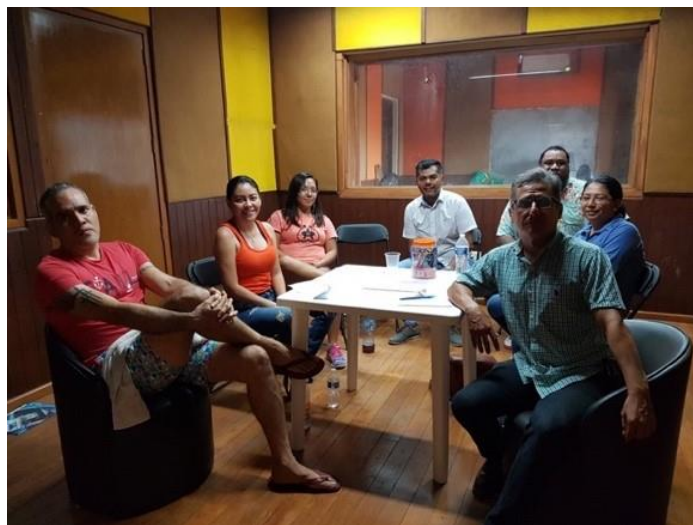
Figura 7. Mesa de trabajo comité 2020. 3 de febrero de 2020