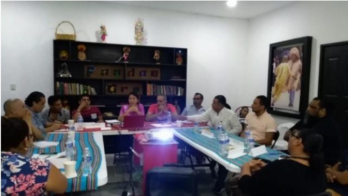
Figura 2. Foro promotores. 18 de febrero de 2019

Con los datos recabados en la mesa, el foro y cuestionarios aplicados a los participantes se hizo un análisis FODA para determinar los aciertos y avances del Festival Fandangro en el ámbito cultural en Acapulco y el estado de Guerrero, se conocieron las acciones que han sido de mayor impacto para los participantes y se logró determinar las áreas de oportunidad a futuro.